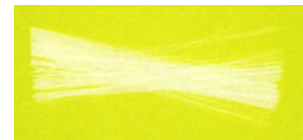
Figura 2 – Fibra óptica.

São cabos de plástico ou vidro, com a capacidade de deixar passar a luz de uma ponta até à outra. Os cabos são muito finos, flexíveis e leves, podendo usar-se vários ao mesmo tempo. Podem ser cosidos na roupa e mudam o ambiente luminoso de um projecto. Servem para trazer a luz do sol para um ambiente interior, por exemplo.