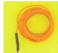
Figura 1 – Cabo electroluminescente.

alternada, que pode ser invertida para corrente contínua, com um inversor. Estes materiais servem para criar uma luz de fundo, para efeitos decorativos.