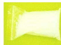
Figura 5 – Materiais fosforescentes.

Tintas que absorvem os raios UV da luz solar, durante o dia, o que os faz brilhar no escuro depois.