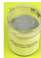
Figura 4 – Tinta Magnética.

Tinta com partículas magnéticas que confere a propriedade de atrair ímanes ao material pintado. Podem pintar-se todos os materiais com esta tinta.