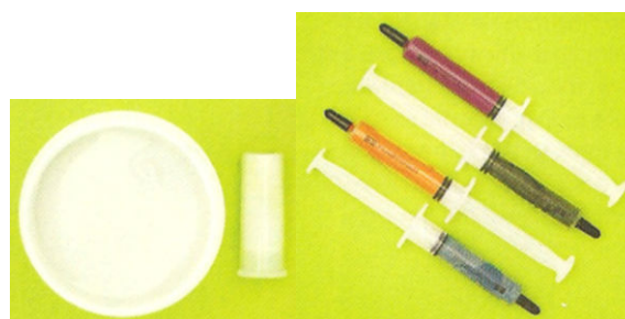
Figura 6 – Tintas sensíveis à temperatura ou aos raios UV.

Pigmentos que necessitam de ser dissolvidos em tintas apropriadas antes de serem usados para pintar qualquer superfície. Ambos alteram a