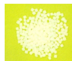
Figura 7 – Plástico Polimórfico.

Plástico que se torna moldável à mão quando aquecido aos 62° C, voltando a ser rígido quando arrefece. Depois de arrefecer, pode voltar a aquecer-se sempre que se quiser, para moldar novamente.